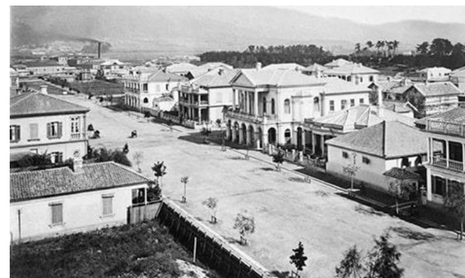
Concession de Kôbe (Kyomachisuji-Avenue) fin 19 e siècle